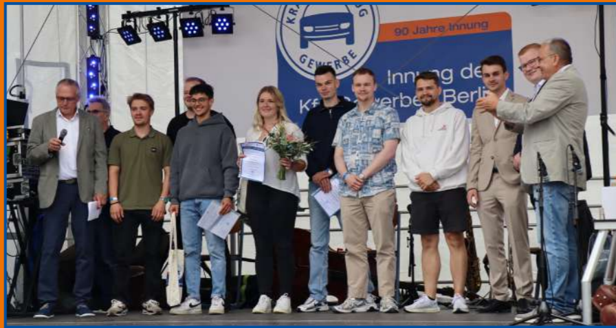
Ehrung der 10 besten Gesellen

Wir freuen uns, dass wir mit unseren Gästen ein tolles Event verbringen und unser Jubiläumsjahr gebührend feiern konnten!