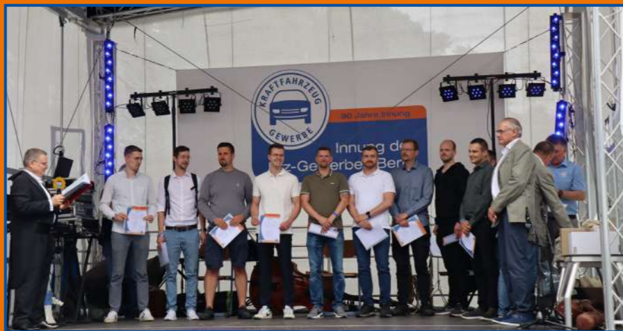
Ehrung der 10 besten Meister