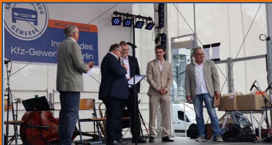
Ehrung der besten Gesellen der Karosserie- und Fahrzeugbauer-Innung